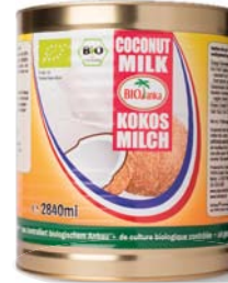
Kokosmilch 2840 ml