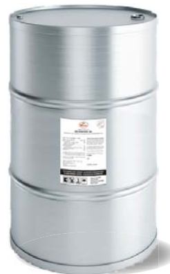
Kokosmilch Fass 200 l Kokosöl Fass 200 l Mangopüree Fass 215 kg