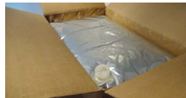
Kokosmilch Bag in Box 20 l