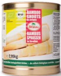
Bambussprossen in Streifen, in Salzlake 2,95 kg