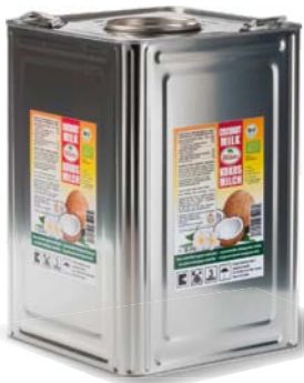
Kokosmilch Kanister 18 l