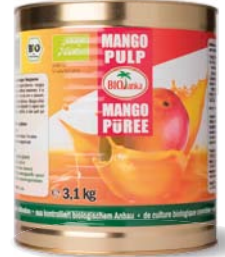
Mangopüree 3,1 kg