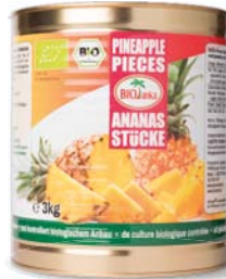
Ananasstücke in Ananassaft 3 kg