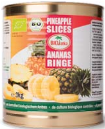
Ananasringe in Ananassaft 3 kg