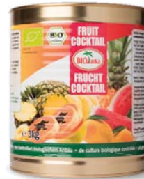
Fruchtcocktail in Ananassaft 3 kg