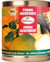
Junge Jackfrucht in Stücken, in Salzlake 3 kg